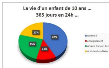
Figure 1 La vie d'un enfant de 10 ans ... 365 jours en 24 heures - Coala 2014