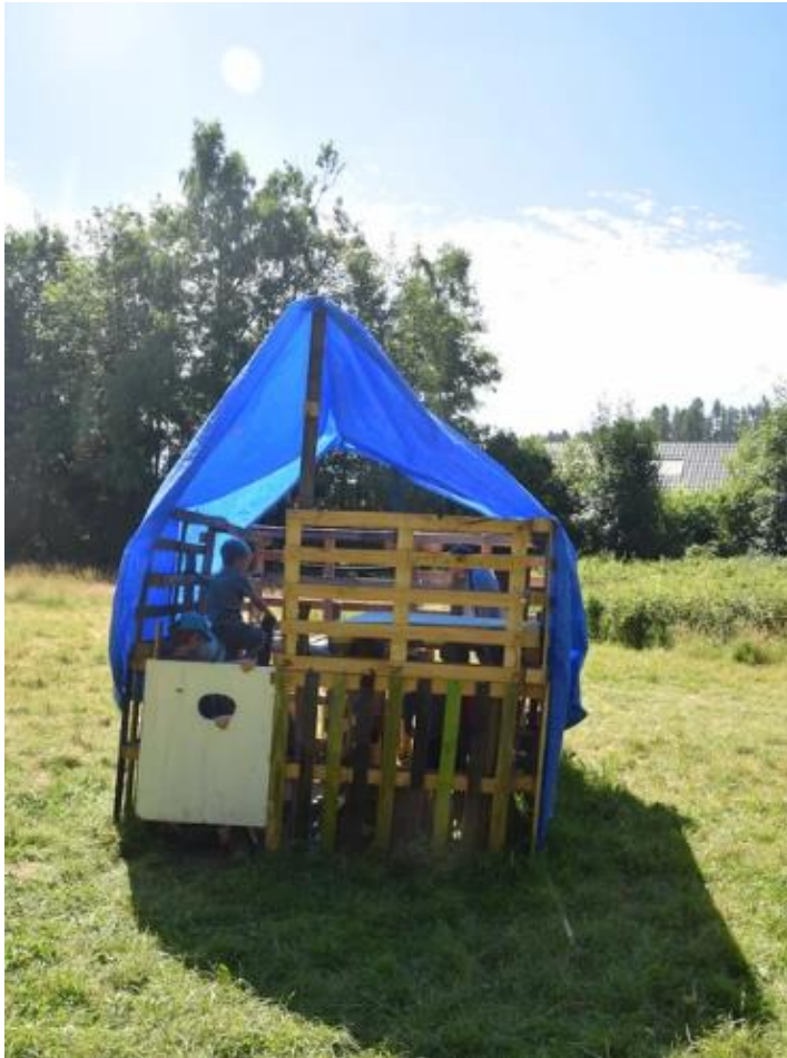
Le village de Cabanes, Le Jardin Imaginaire, Jouer dehors asbl, Poulseur