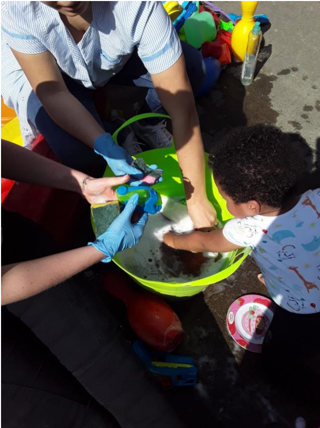
Halte-accueil L'Aquarelle, Laeken

Recherche & Innovation Enfants - Parents - Professionnel·le·s