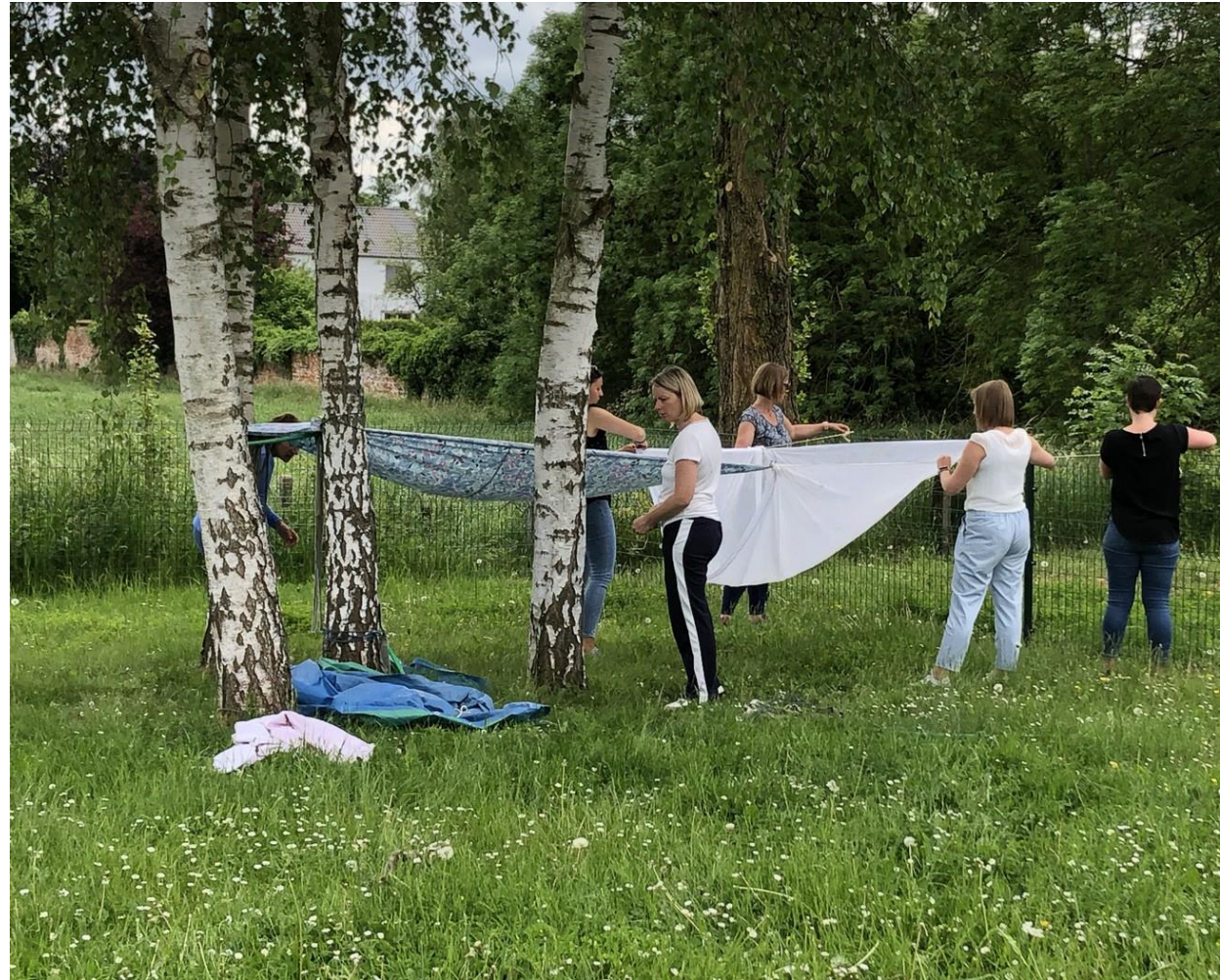
Une équipe en formation continue, RIEPP